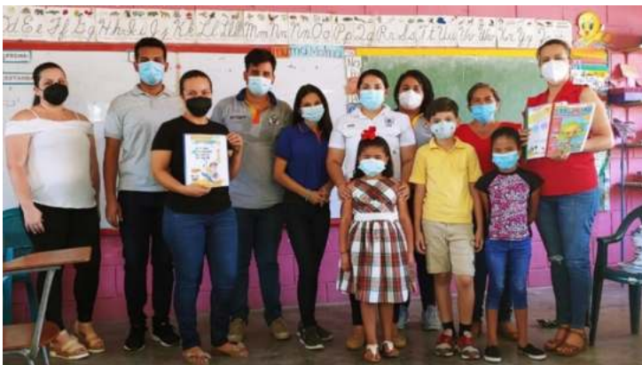
Figura 2. Entrega de material didáctico a CEB.

Otro de los problemas que se evidenciaron es la poca asistencia de la comunidad a las reuniones convocadas, para organizar los equipos de trabajo, desarrollar las intervenciones y capacitaciones. Conforme a los datos cuantitativos el 46% aseguró que muchas veces la población se muestra desinteresada o cansada. Desde la perspectiva cualitativa, este hallazgo se pudo validar con la aseveración de los estudiantes vinculados con el proceso de interacción con la comunidad, quienes expresaron: “[...] es complicado, muchas veces hacíamos las convocatorias y solo llegaban algunos pocos, en muchas ocasiones no teníamos la participación deseada, pero seguíamos adelante con el proyecto” .