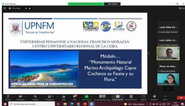
Figura 1. Reunión virtual vía Zoom

Se calcula que 1, 184, 126, 508 de estudiantes fueron retirados del sistema presencial en todo el mundo, lo que es, aproximadamente, un 67.6% de alumnos matriculados (UNESCO IESALC, 2021).