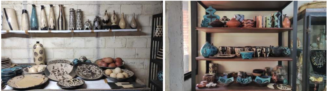
Figura 1. Objetos de alfarería Lenca (Sur de Honduras)

Nota. Fuente: fotografías tomadas en el museo de inventario de ACTA, 2023.