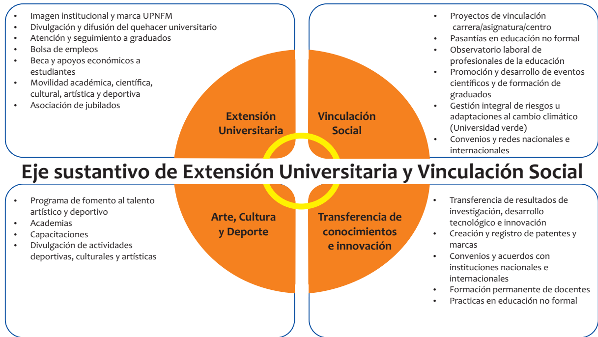
Figura 1. Modelo de reconceptualización del eje sustantivo Nota: Tomado de Eguigure (2018)

Dirección de Extensión debería alinearse con la integración de las funciones sustantivas y la vinculación con la sociedad, el estado y los sectores productivos.