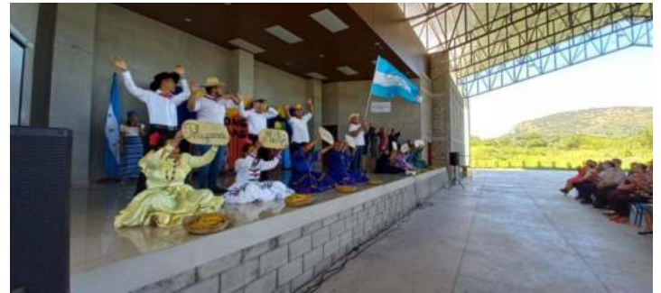
Figura 2. Representación artística en Congreso Pedagógico 2022

reivindicación de los saberes y su construcción. Finalmente, se realiza una conferencia de cierre, que en cada Congreso ofrece una visión integral y de interpretación por adentrarnos a la experiencia más grata y maravillosa que ofrece la Educación en la vida del hombre.