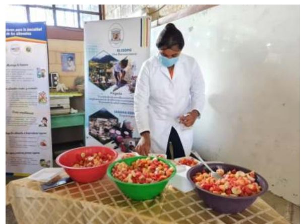
Fotografía 2. Estudiante extensionista durante el desarrollo de los talleres sobre merienda escolar

Durante la pandemia, la carrera de Profesorado en la Enseñanza del Español replanteó sus líneas de acción en cuanto a la vinculación social, con el objetivo de dar respuesta a los problemas educativos generados por la COVID-19, entre ellos: ¿Cómo atender a los estudiantes de los diferentes niveles del sistema educativo público? Así, inició el proyecto piloto para dotar de plataformas educativas a los centros gubernamentales beneficiarios y, por consiguiente, la capacitación sobre el uso de las herramientas y beneficios de Google for Education, dirigida a docentes, padres de familia y estudiantes, puesto que los beneficiarios urgían de capacitaciones para el manejo de las Tecnologías de la Información y la Comunicación (TIC), las que se programaron en esos momentos de pandemia, a través de videos informativos que contenían la conceptualización, el manejo y uso de las herramientas de la página Web y de la plataforma. De esta manera, se conectó a los docentes y estudiantes