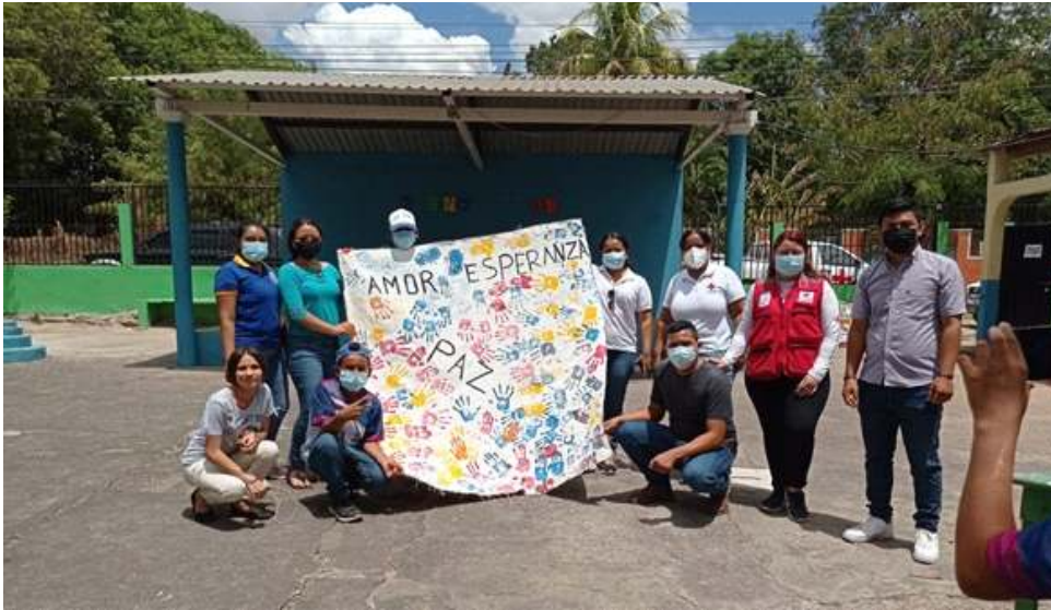
Fotografía 3. Estudiantes extensionistas y personal de la Cruz Roja Hondureña durante el desarrollo de una capacitación sobre violencia social, inseguridad ciudadana y bullying en las instalaciones de la Escuela José Simón Azcona, Choluteca.

métodos efectivos para la filtración del agua, así como sobre las medidas aplicables a situaciones de riesgo, por efecto de inundaciones. Algunas de las actividades de intervención del proyecto incluían el desarrollo de charlas informativas y talleres demostrativos sobre la construcción de un filtro con materiales de bajo costo, con la finalidad de proporcionar alternativas para el uso de agua, en situaciones de riesgo (Fotografía 4). El proyecto también implementó actividades encaminadas a fortalecer el Comité de Emergencia Local (CODEL), a través del desarrollo de capacitaciones referidas a temas de