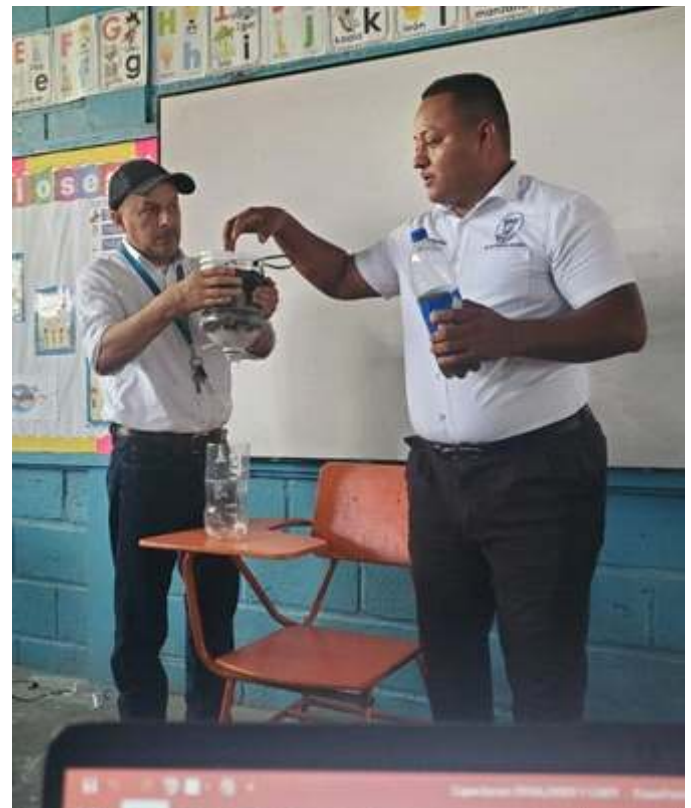
Fotografía 4. Demostración de la construcción de un filtro casero para el mejoramiento de la calidad del agua en situaciones de escasez por emergencia de inundaciones.

El Centro de Educación Básica José María Ferrero, localizado en el municipio de El Progreso del departamento de Yoro, está, constantemente, expuesto a riesgos por inundaciones por su cercanía a la ribera del río Ulúa en el Valle de Sula. Como consecuencia de esta exposición, los habitantes de la comunidad y estudiantes del centro educativo afrontan dificultades con respecto al acceso y a la calidad de agua disponible durante las inundaciones. En ese sentido, un equipo de estudiantes de la carrera de Profesorado en Ciencias Sociales diseñó un proyecto de extensión, con el objetivo de informar a la población meta acerca de los