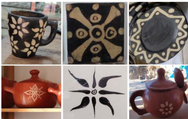
Figura 3. Simetría axial en los motivos decorativos de la cerámica Lenca

Si bien, existe evidencia de simetría axial en los motivos decorativos del arte Lenca, tanto en el sur como en el occidente de Honduras, la tendencia, en la mayoría de los casos, es que no se preserve la simetría axial. Esta se rompe por el uso de figuras iniciales tales como espirales, animales, hojas, entre otros detalles, que, adicionalmente, se trasladan y rotan. En algunos casos, la simetría se quebranta por detalles en el trazado de líneas. En el panel de la Figura 4 se presentan algunos de estos casos. Estas asimetrías son más frecuentes en la alfarería del sur del país.