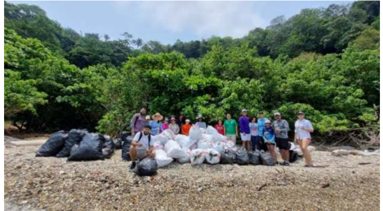
Figura 3. Actividades ejecutadas

cartillas de trabajo, manuales, entre otros; frente a las exigencias de la comunidad en el nuevo contexto.