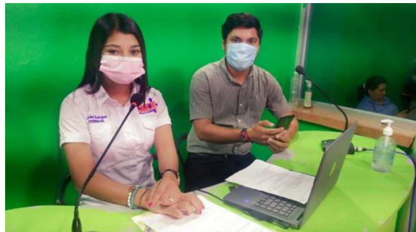
Fotografía 1. Estudiantes durante la capacitación "Cómo fomentar la cultura del ahorro", en las instalaciones de la televisora del grupo Harko visión del Municipio de Nacaome, Valle.

la COVID-19. Así surgió el proyecto titulado Economía y Finanzas en tiempos de pandemia y la aplicación de las medidas de bioseguridad ; este tuvo como objetivo enseñar acerca de la educación financiera familiar y las medidas de bioseguridad para mitigar el impacto producido por la pandemia que enfrentaba la sociedad, favoreciendo el bienestar integral en esta comunidad. Sobre este proyecto, por una parte, se llevaron a cabo actividades de capacitación, las cuales fueron televisadas a la teleaudiencia del grupo Harko visión del Municipio de Nacaome, Valle; con el fin de enseñar el manejo de las finanzas familiares (Fotografía 1). Por otra parte, se realizaron anuncios publicitarios, así como, mensajes impresos, en los cuales se muestran las medidas de bioseguridad para la prevención de la COVID-19, recomendadas por la Organización Mundial de la Salud [OMS].