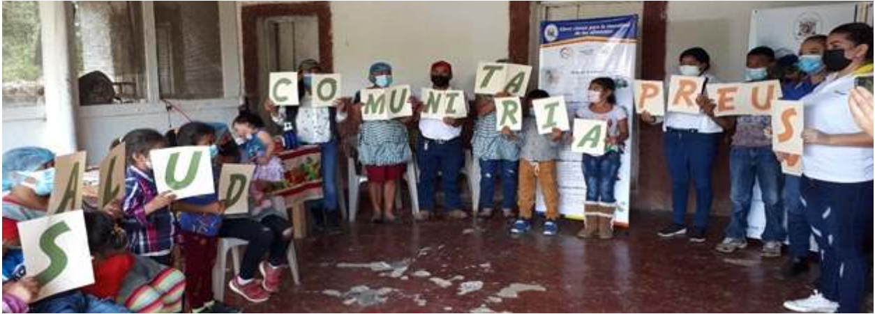
Ilustración 2 Habitantes de Lepaterique, en jornada de PREUUS

PREUUS: Este es uno de los proyectos más destacados, conocido, en sus inicios, como Trabajo Educativo Social Universitario (TESU) y, luego, como Proyecto de Extensión (PREX). Este espacio de aprendizaje cumple con el objetivo primordial de establecer lazos entre la vida universitaria, con todo su conocimiento y técnica, y las comunidades de distinta índole. Por lo tanto, es el puente que permite la integración de los esfuerzos de docentes y estudiantes que aportan respuestas a las demandas que la sociedad presenta. Todo ello, enmarcado en un proceso de diagnóstico previo y planificación oportuna. Es de suma importancia, destacar los logros, en materia de acercamiento y diálogo de saberes con las comunidades, puesto que, se ha alcanzado su efectividad, gracias a los aportes en recursos, tanto humanos como financieros, con los que han contribuido los estudiantes, acompañados por los docentes extensionistas de las distintas carreras que ofrece la UPNFM.