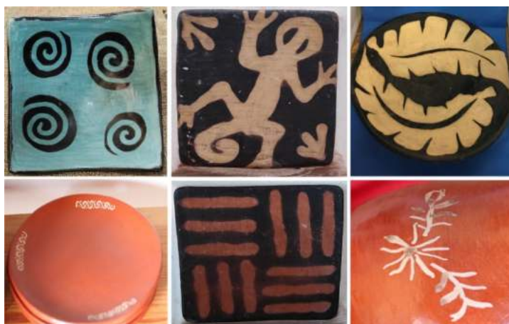
Figura 4. Asimetrías en los motivos decorativos de la cerámica Lenca