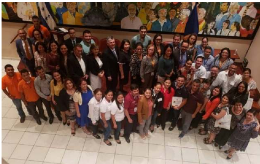
Figura 2. Memoria de fotografías del I CONEUVS, 2019

El evento contó con la participación de varias universidades nacionales (Figura 2), entre ellas la Universidad Nacional Autónoma de Honduras (UNAH), la Universidad Nacional de Agricultura (UNAG), la Universidad Nacional de Ciencias Forestales (UNACIFOR). De igual manera, representaciones docentes y estudiantiles de los Centros Universitarios Regionales de la UPNFM, entre ellos: CUR San Pedro Sula, CUR La Ceiba, CUR Santa Rosa de Copán, CRU Gracias, CRU Nacaome, CRU La Esperanza, CRU Danlí y CRU Juticalpa: Además, se contó, con la presencia de representantes de varias sedes del CUED, así como docentes y estudiantes del Campus Central de la UPNFM.