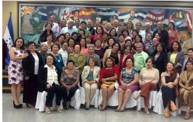
Ilustración 1 Miembros de la ASOJUBI