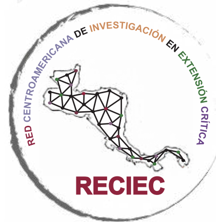
Ilustración 3: Logo RECIEC

1996, lo cual ha permitido que la Universidad, se haya integrado, de forma exitosa, en el concierto regional de la Extensión Universitaria, iniciando, de esta manera, el camino de la Extensión Crítica, a través de la Red Centroamericana de Investigación en Extensión Crítica (RECIEC), como una estrategia de integración de las funciones sustantivas de la universidad, es decir, la docencia, la investigación y la extensión, lo que permite la generación de investigación, y, en general, dar respuesta a las demandas sociales de actualidad.