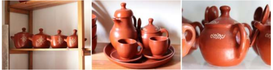
Figura 2. Objetos de alfarería Lenca (Occidente de Honduras)

En cuanto a los motivos decorativos base de la cerámica Lenca, predominan puntos, líneas, espirales, triángulos, rectángulos, hojas y flores. Adicionalmente, se utilizan, en menor medida, dibujos de animales, tales como, tortugas, geckos e iguanas.