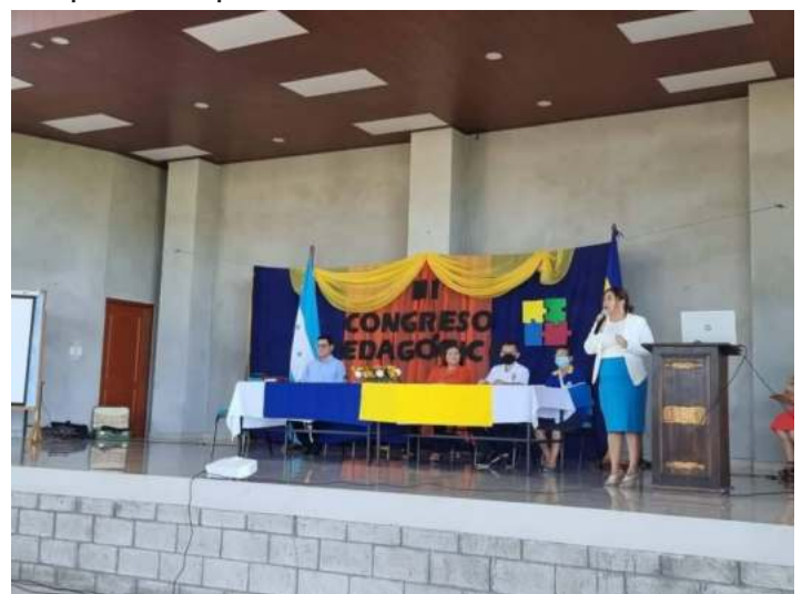
Figura 3. Representación en Congreso Pedagógico 2022 Dirección Departamental/UPNFM.

Es importante mencionar, que en el más reciente Congreso Pedagógico realizado, de forma conjunta, entre la UPNFM y la Dirección Departamental de Educación de Valle, se presentan diversos planteamientos para favorecer la actualización de los educadores y académicos de la región, en donde los retos de la Pandemia se han convertido en aprendizaje híbrido y bimodal de la postpandemia con enfoque de competencias digitales hacia el conectivismo digital de la educación de nuestro siglo XXI. En tal sentido, la coordinadora del Centro Universitario Regional de Nacaome expresa sus inquietudes pedagógicas, siempre dando apertura, con dinamismo y asertividad, ante las demandas y exigencias de las políticas de Estado y Educativas en la educación superior del país.