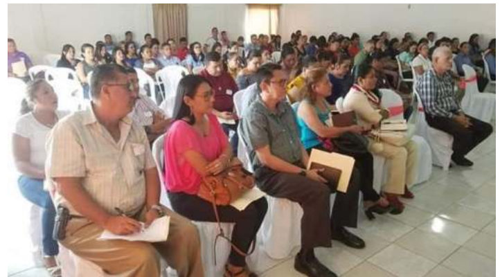
Figura 1. Participantes en Mini Congreso de Ciencias Sociales

Los Congresos Pedagógicos están dirigidos a los maestros, en general, se realizarán como un proceso donde los problemas identificados en la consulta por la calidad educativa, se convierten en temas de investigación y de formación, con una dinámica metodológica que comience con el análisis de la práctica para la programación de la transformación (Ministerio del Poder Popular para la Educación, Rev. 7 p.1).