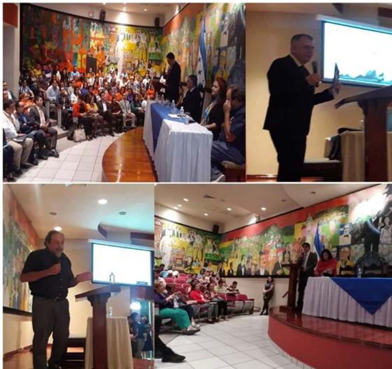
Figura 3. Memoria de fotografías del I JNEUVS -2020

La generación de propuestas e iniciativas tendientes a contribuir en cambios en las actividades universitarias parte de no solo modificar los planteamientos de un eje estratégico, implica también repensar el quehacer mismo de la universidad y como está asume su compromiso con los procesos de desarrollo y transformación de la sociedad de la cual es parte activa.