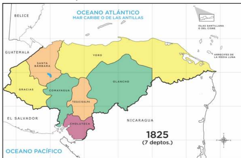
Dirección General de Estadística y Censos, citado por Aguilar, 1999, p. 213

La independencia de Centroamérica llegó en 1821, pero siguieron durante muchos años los esfuerzos tendientes a establecer la Federación Centroamericana. De esta manera, las perspectivas se definieron más en relación con las corrientes de la zona, los enfrentamientos entre grupos locales y grupos integracionistas para establecer el Estado-Nación.