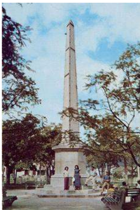
Foto 3 Monumento El Obelisco, [década de 1950]. https://www.pinterest.co.kr/pin/829717931320486006/