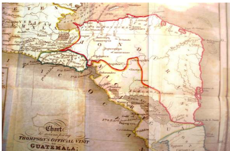
Thompson, 1798, citado por Davidson, 2006, p.197