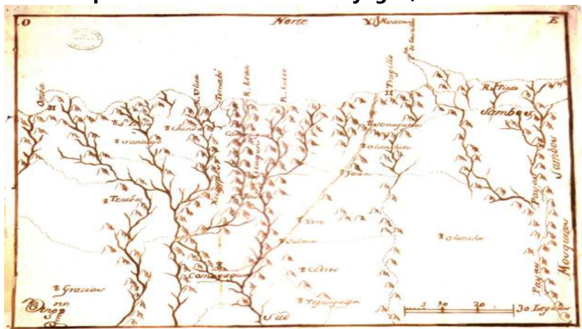
Anguiano, 1798, citado por Davidson, 2006, p. 187