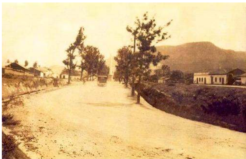
Foto 1 Paseo Guacerique con el Obelisco del Centenario al fondo. Año 1923. Cultura de Honduras, 2021 4