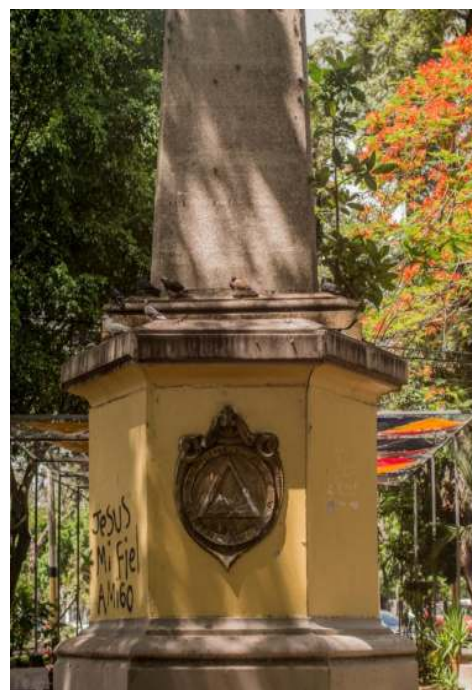
Foto 4 El Obelisco.